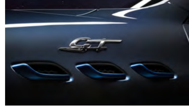
ليفانتي GT هايرد - فتحات هواء جانبية وشعار GT