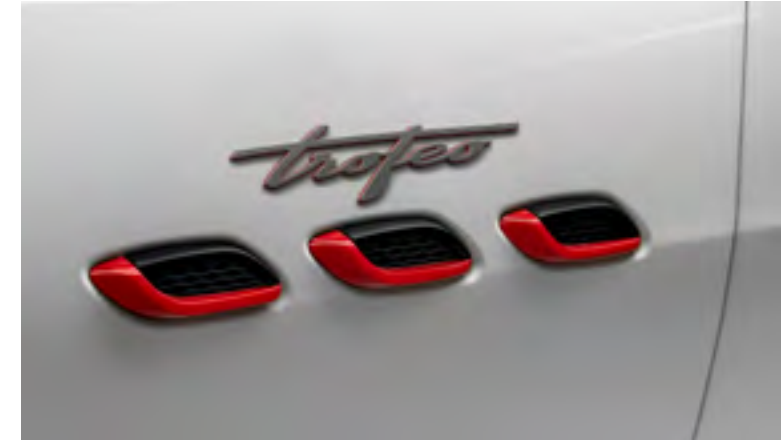
ليقانتي تروفيو - فتحات هواء جانبية وشعارات تروفيو