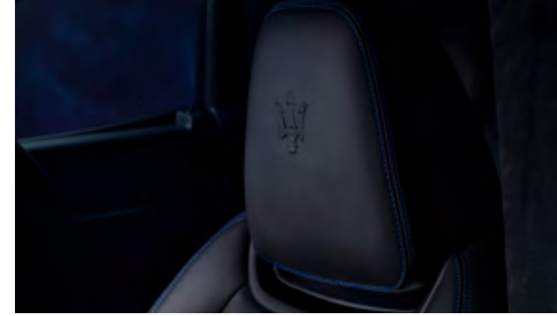
ليفانتي GT هايرد - تفاصيل مسند الرأس