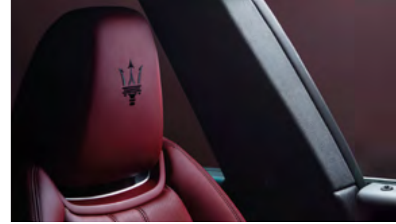
ليفانتي - تفاصيل مسند الرأس