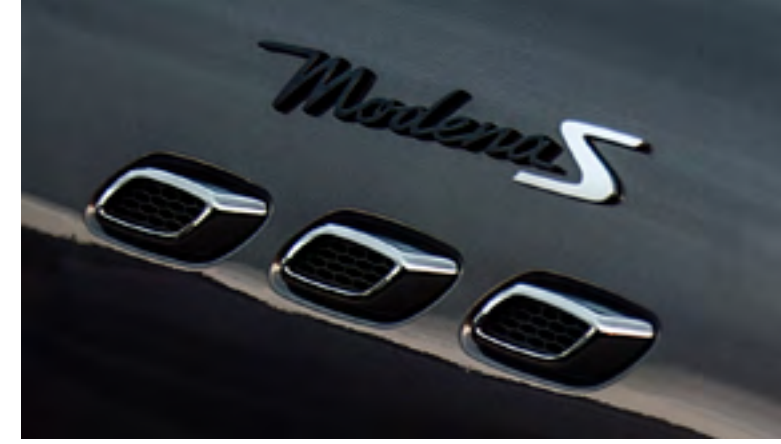
ليفانتي - فتحات هواء جانبية وشعار مودينا