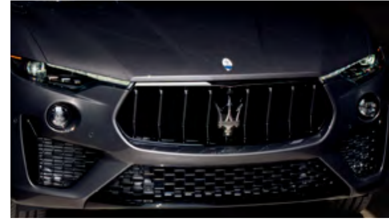
ليفانتي - الشبكة الأمامية