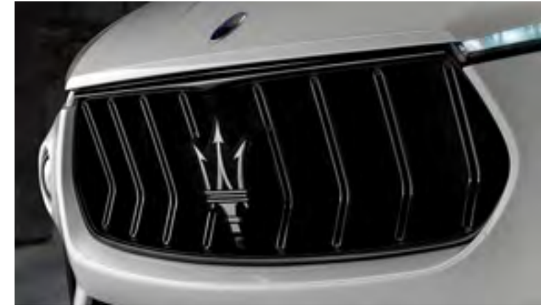
ليقانتي تروفيو - الشبكة