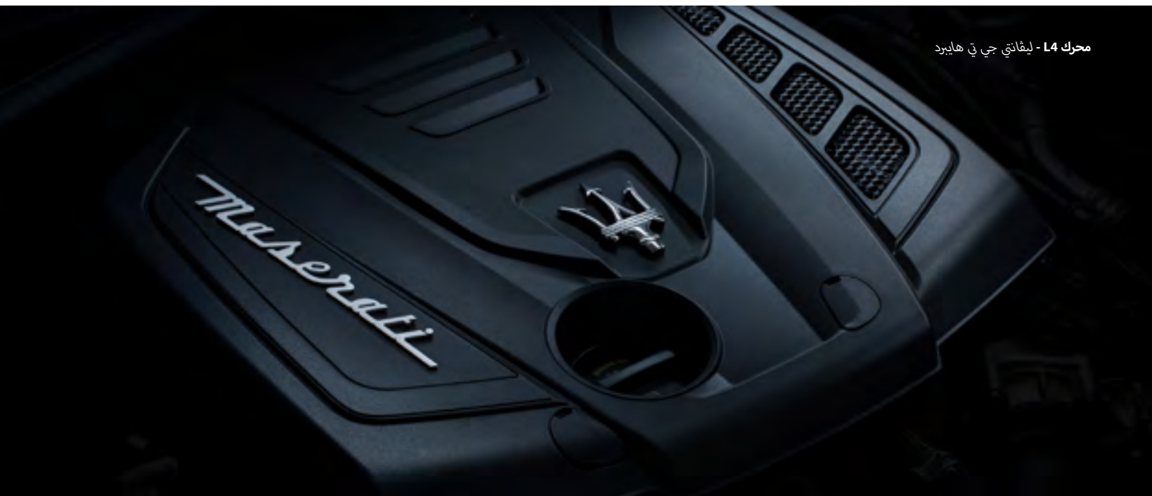
محرك L4 - ليفانتي جي تي هايبرد