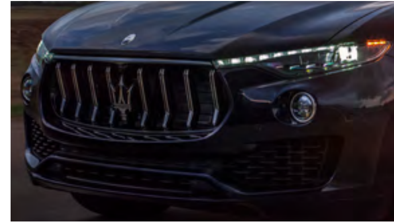
ليفانتي GT هايرد - الشبكة الأمامية