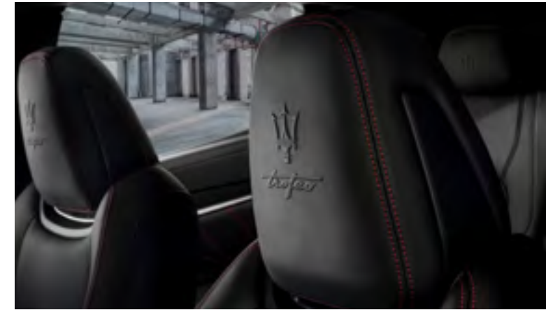
ليقانتي تروفيو - تفاصيل مسند الرأس