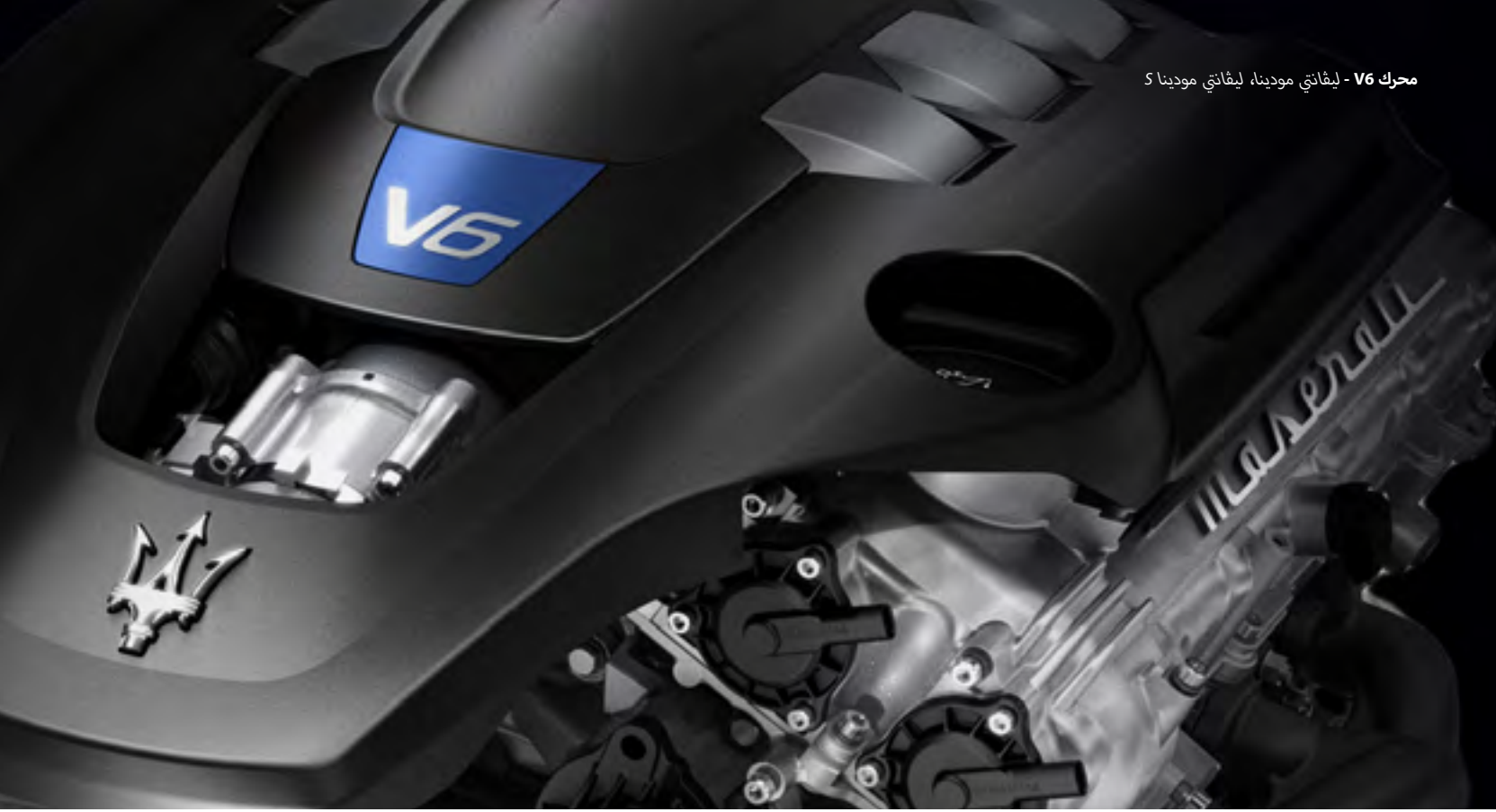
محرك V6 - ليفانتي مودينا، ليفانتي مودينا S