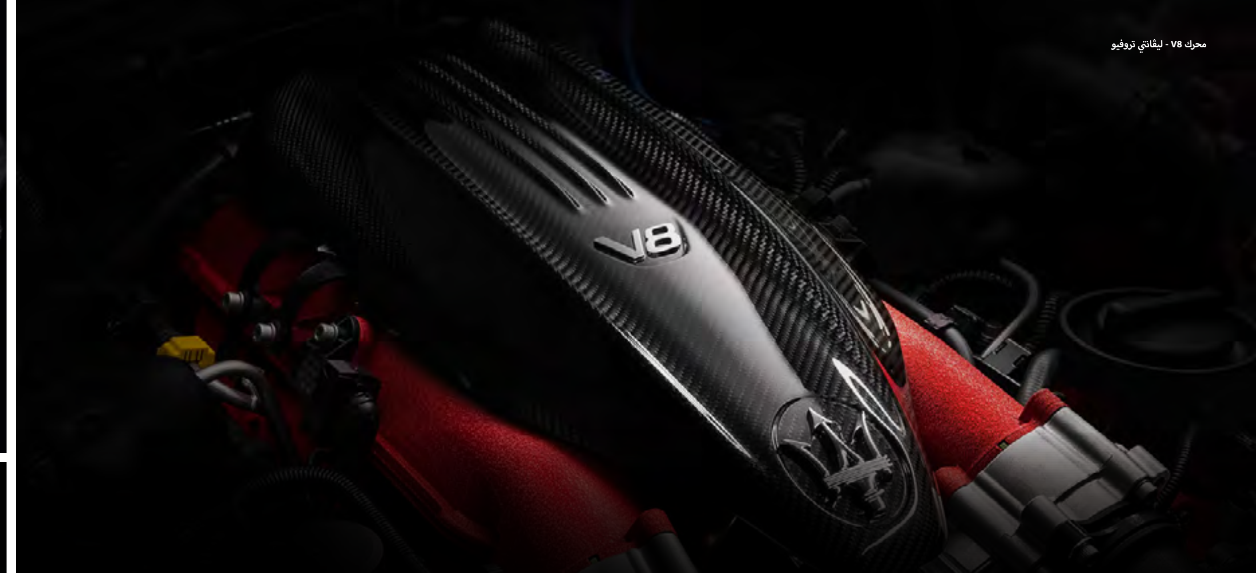
محرك V8 - ليفانتي تروفيو

تقدم المحركات في إصدارات ليفانتي المختلفة كل ما تتوقعه من سيارة مازيراتي - من الاستجابة الهادئة إلى تحسين سلاسة القيادة في المسافات الطويلة. كما تتسم هذه المحركات بكونها ذات أداء فعال بشكل ملموس.