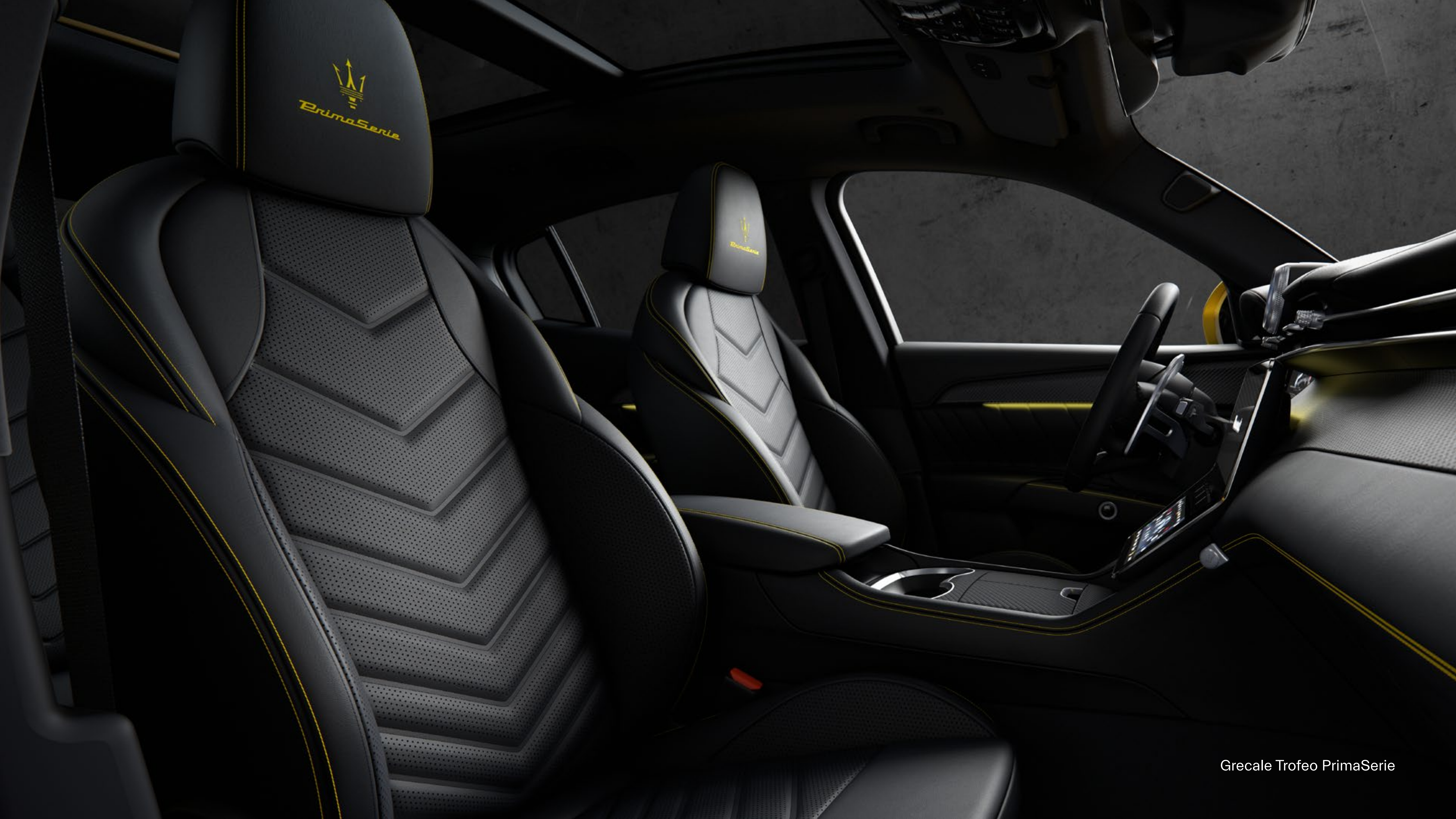
Grecale Trofeo PrimaSerie