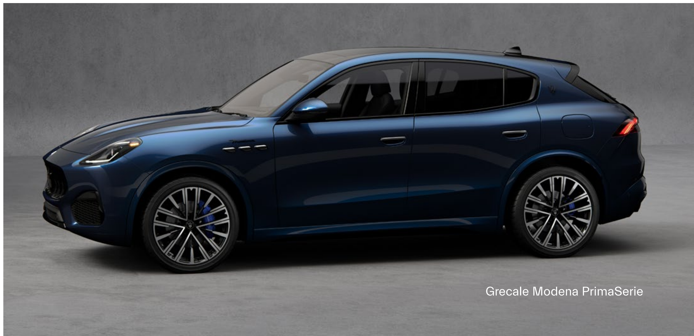
Grecale Modena PrimoSerie